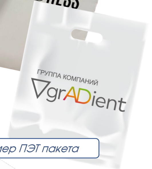
Пример ПЭТ пакета

Самый действенный предмет рекламы, благодаря которому повышается узнаваемость не только в компаниях, но и среди людей на улице. Просто представьте, сколько человек увидит Ваш логотип, пока человек с выставки доедет до своего офиса или дома.