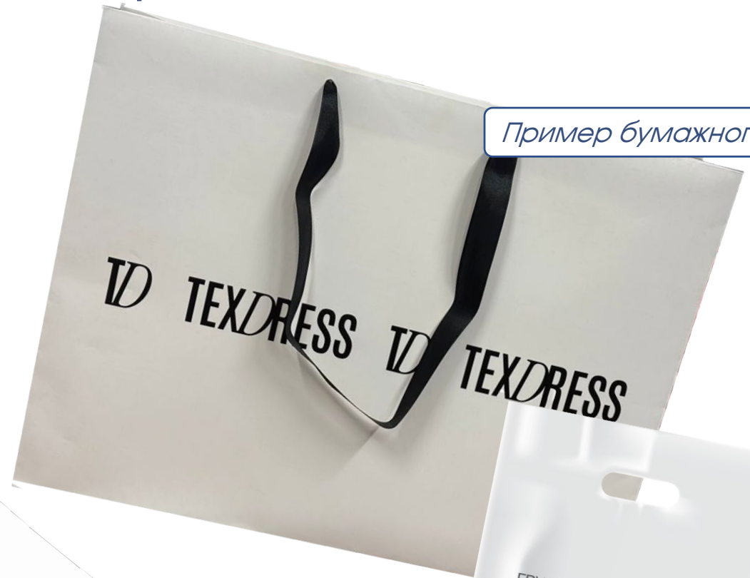
Пример бумажного пакета

Самый действенный предмет рекламы, благодаря которому повышается узнаваемость не только в компаниях, но и среди людей на улице. Просто представьте, сколько человек увидит Ваш логотип, пока человек с выставки доедет до своего офиса или дома.