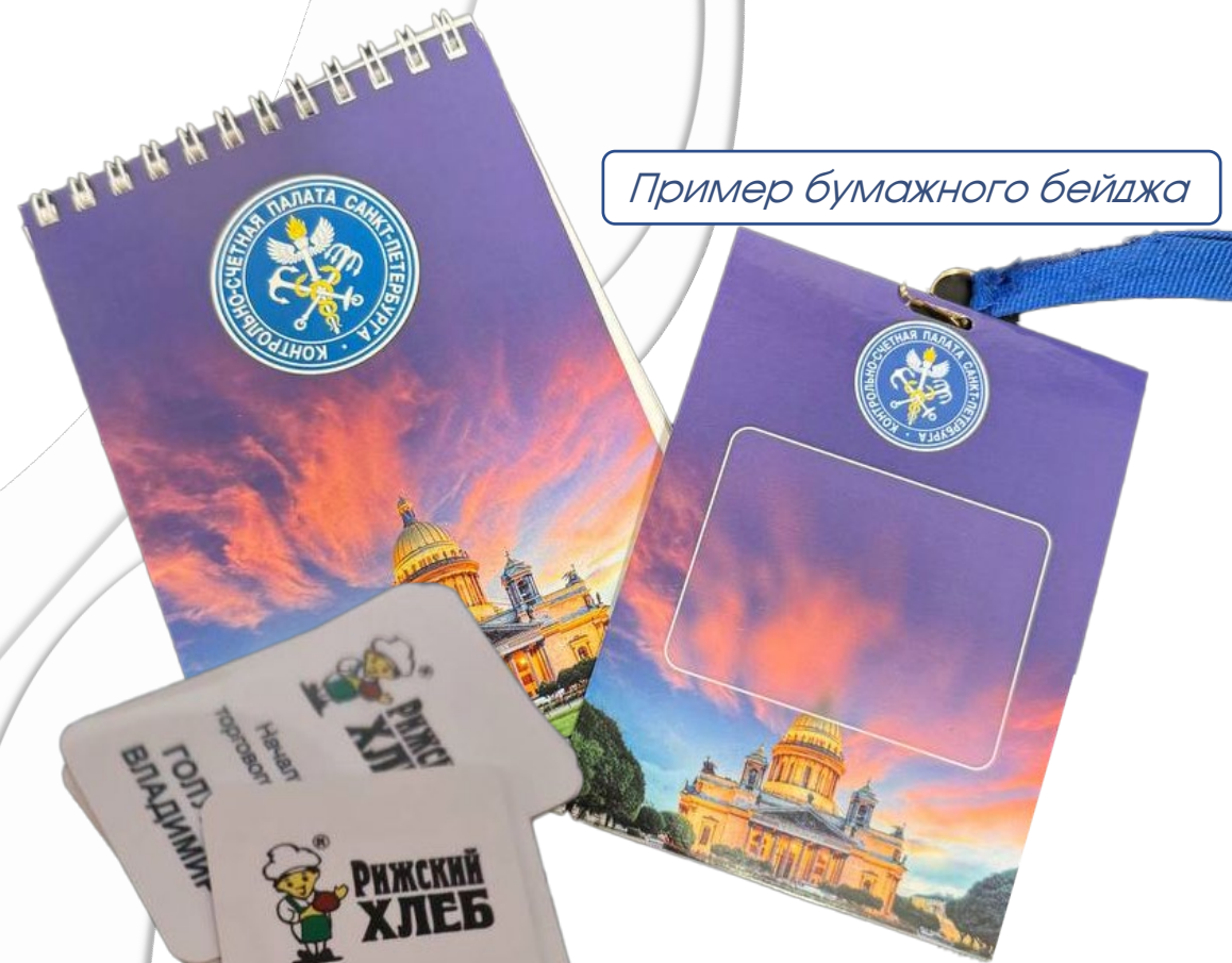
Пример бумажного бейджа

Блокноты необходимы для записи важной информации, контактов, идей и планирования встреч, а также для контроля бюджета и фиксации творческих мыслей. Бейджи используются для идентификации участников, обеспечения доступа к специальным зонам и облегчения общения, а также служат инструментом маркетинга и брендинга.